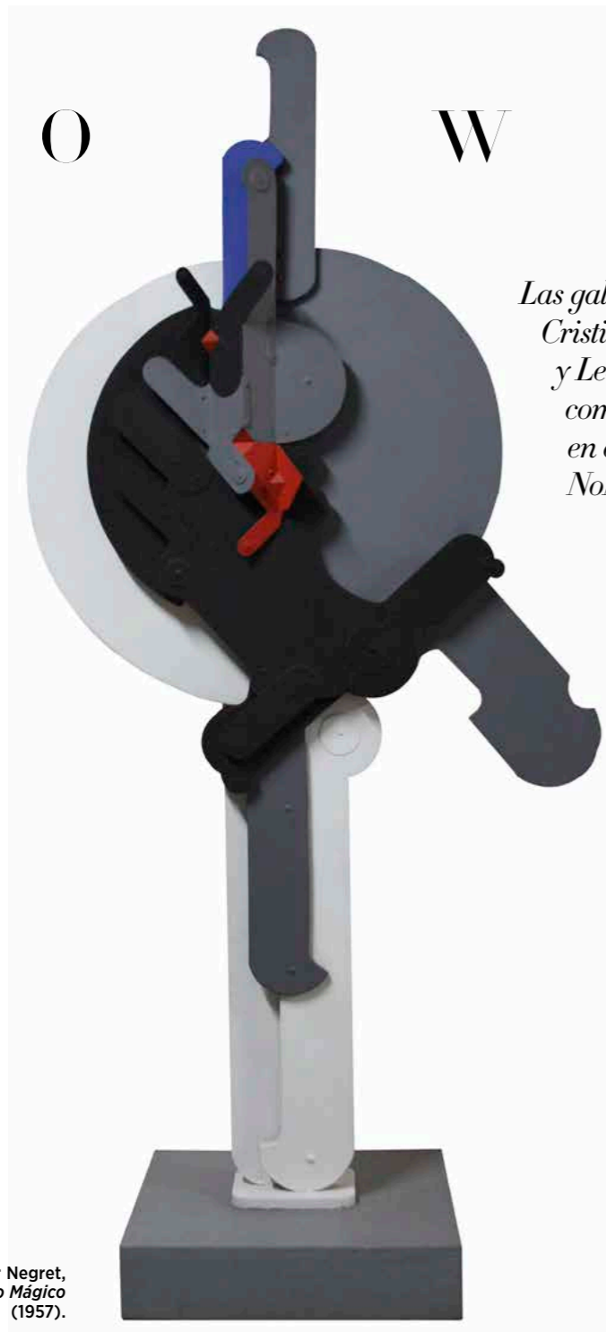
Edgar Negret, Aparato Mágico (1957).

Las galerías neoyorquinas Cristina Grajales Gallery y Leon Tovar Gallery comparten una nueva sede en el distrito NoMad de Manhattan.