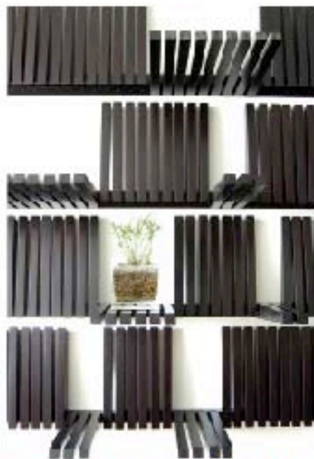
UN MAESTRO DE LOS ESPACIOS Y LA LÍNEA