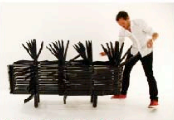
CREACIONES AVANT-GARDE CON HUMOR

incluidas formaron un poderoso coctel de ingenio, talento, humor y drama, que resulta evidente en piezas como su famosa Goose Lamp , que tiene cabeza de lámpara pero el cuerpo de un ganso taxidérmico.